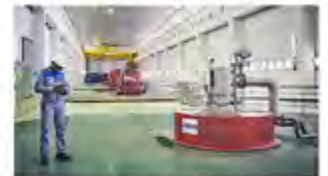
Kraftwerkshalle des Wasserkraftwerks Inga I in der Demokratischen Republik Kongo