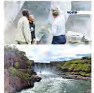
Wasserkraftwerk Cambambe in Angola